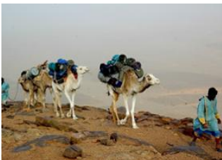
Oued Oua'n Amoûr ♡ El Beyyed ♡