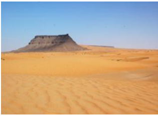
Tarf Tazazmout 📍