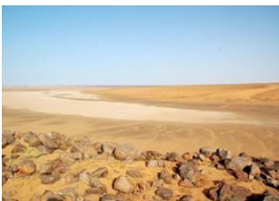
Hassi Thiba 📍