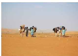
Erg Maghteïr Camp 2 📍