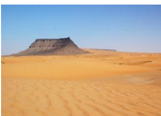
El Beyyed ♡