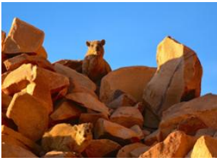
Guelb Er Rîchat (Camp Boisé) ♡ Tilililit ♡