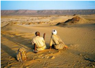
Oum El Beidh 📍