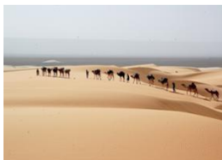
Erg Maghteïr Camp 1 📍