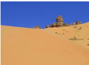
Zarga 📍 6km - ⌚ 3h Tichilit el Âteg 📍 🚗 45km - ⌚ 1h 30m Atar 📍