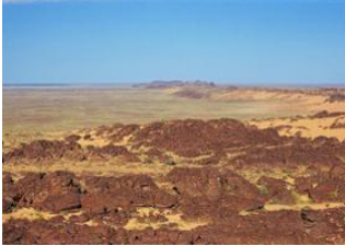
Guelb Er Raoui 📍 15km - 🕒 5h Zarga 📍