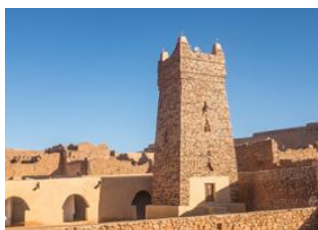
Touiyert 📍 8km - 🕒 4h Chinguetti 📍