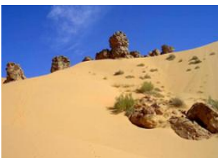
Zarga 📍 6km - 🕒 3h Tichilit el Âteg 📍 🚗 45km - 🕒 1h 30m Atar 📍