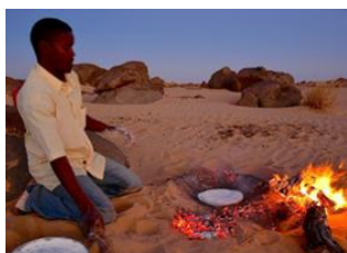
Tanouchert 📍 7km - ⌚ 3h Sud Herour 📍