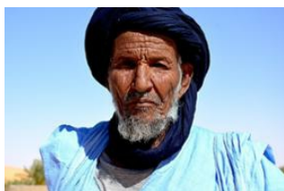
Herour Nord 📍 8km - ⌚ 3h 30m Tanouchert 📍