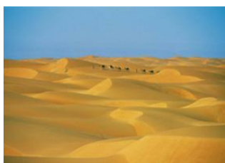
Sud Herour 📍 10km - ⌚ 4h Atilait Ould Elbeinan 📍