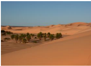
El Meddah ♡ 14km - ⌚ 5h Erg Amatlich ♡