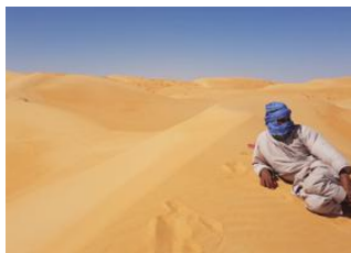
Bou Aboun 📍 18km - ⌚ 6h Foum Tigent 📍