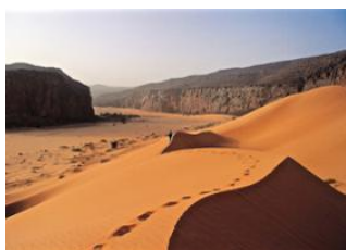
Foum Tigent 📍 14km - ⌚ 5h Hnouk 📍