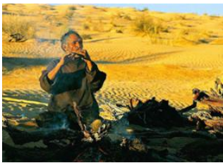
Hnouk 📍 18km - ⌚ 6h El Mghaïmin 📍