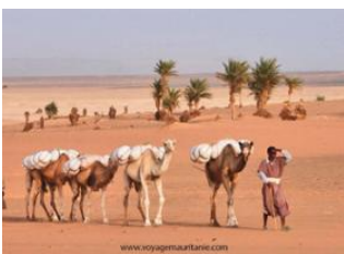
Oued El Bhair 📍 15km - ⌚ 5h Erg Taffoujert 📍