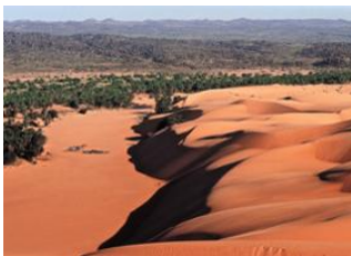
Erg Amatlich ♡ 15km - ⌚ 5h Azoueiga ♡