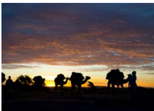
El Mghaïmin 📍 20km - ⌚ 6h 30m Oudeï En Na'am 📍