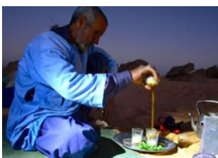
Azoueiga ♡ 8km - ⌚ 3h Graret El Vras ♡ 🚗 55km - ⌚ 2h Atar ♡