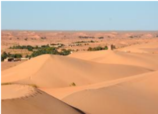
Chinguetti 📍 🚗 150km - ⌚ 6h Oued El Bhair 📍