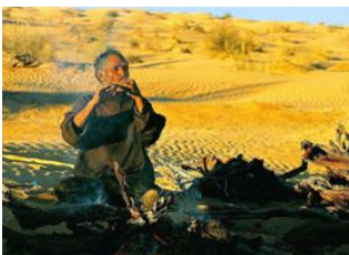
Guelb Ajat 📍 16km - ⌚ 6h Bou Aboun 📍