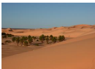
El Meddah ♡ 14km - ⌚ 5h Erg Amatlich ♡