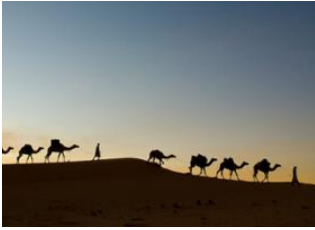
Erg Taffoujert 📍 16km - ⌚ 5h 30m Guelb Ajat 📍