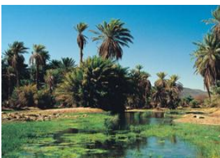
Hassi Naïtiri 📍