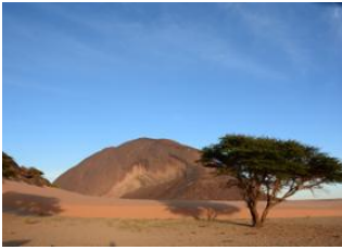
Choum 📍 🚗 80km - ⌚ 2h 30m Ben Amira 📍