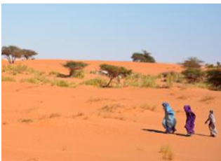
Chinguetti 📍 🚗 90km - ⌚ 4h Wadane 📍